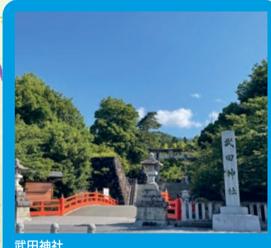
武田神社 武田氏館跡(国指定史跡)に鎮座する武田神社は、武田信玄公が祀られ、「勝運」のパワースポットとして知られています。境内の宝物殿には、鎧・甲冑・刀剣など、武田家ゆかりの品が展示されています。