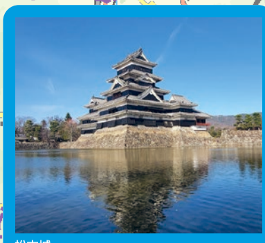
松本城 国宝の「天守」は1593~4年に築造され、現存する五重六階の天守としては日本最古の城。雄大な北アルプスを背景に、四季の移り変わりと共に見事な景観を楽しめます。