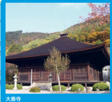
大善寺 開山は718年で薬師堂は国宝。別名ぶどう寺ともいわれ、5年に1度の御開帳時には手にぶどうをのせた「薬師如来像」を拝観できます。県文化財の庭園を望みながらグラスワインが飲めるのも大善寺ならでは。