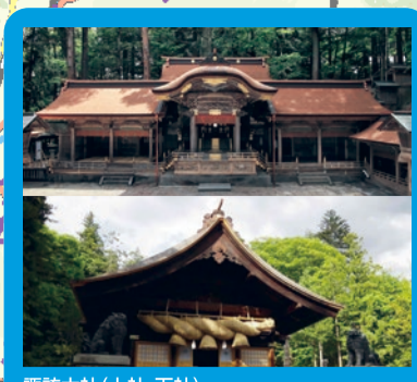
諏訪大社(上社・下社) 国内最古の神社の一つ。諏訪湖周辺の4宮の境内地で構成され、湖の南岸に上社、北岸に下社があります。7年に1度の御柱祭は独特でダイナミックな祭りとして知られ、多くの見物客が訪れます。