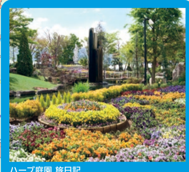
ハーブ庭園 旅日記 四季折々のハーブと花が楽しめる庭園や、旅の疲れを癒してくれるカフェ、オリジナルハーブグッズが作れる工房、ハーブ製品のほか、山梨の地場産品が購入できます。