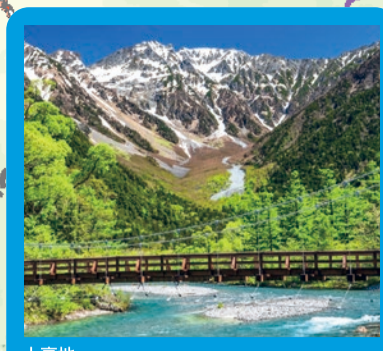
上高地 標高約1,500mの山岳景勝地で、国の文化財に指定されています。宿泊施設や温泉があり、散策や登山、満天の星空など、様々なスタイルで大自然を満喫できます。(入山期間:例年4月中旬~11月15日)